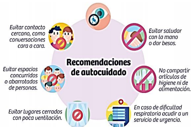
Fig 1: